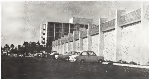
Vista di parti pariba di Holiday Inn Hotel di Aruba.